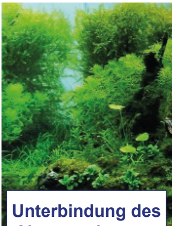
Unterbindung des Algenwachstums

Diese Technologie der sogenannten Wasserelektrolyse wird von uns bereits seit über 15 Jahren erfolgreich in der industriellen Wasser-Desinfektion und -Entkeimung eingesetzt. Nun findet diese Technologie auch ihren Einsatz in der Wasserbehandlung von Aquarien.