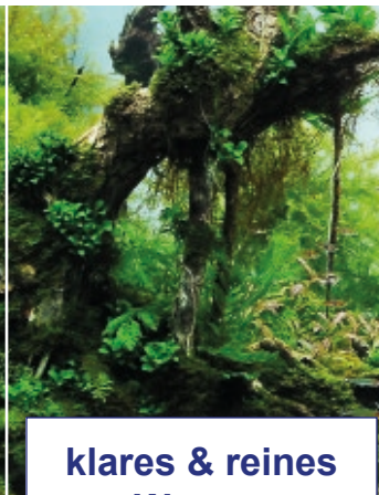
klares & reines Wasser